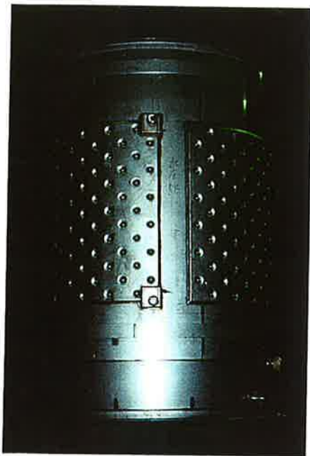
ジャケット取付形状 (3000ℓ開放タイプ)